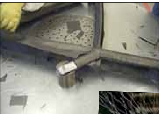
Pose des tresses de fibres (jusqu'à 30 couches)