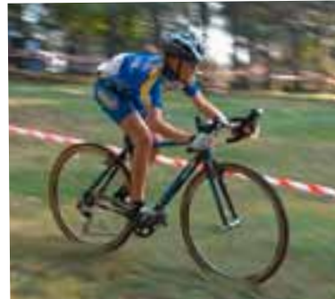
Album photos ICI

Au fait, j'allais oublier !!! Un record de participation : 96 coureurs, dont 40 enfants de 7 à 16 ans, qui se sont surpassés sur 3 circuits tracés sur le site magnifique qu'est le Parc de Parilly. J'allais oublier, la Direction du