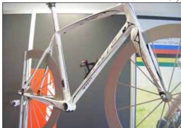
Le VRS Fluidity blanc