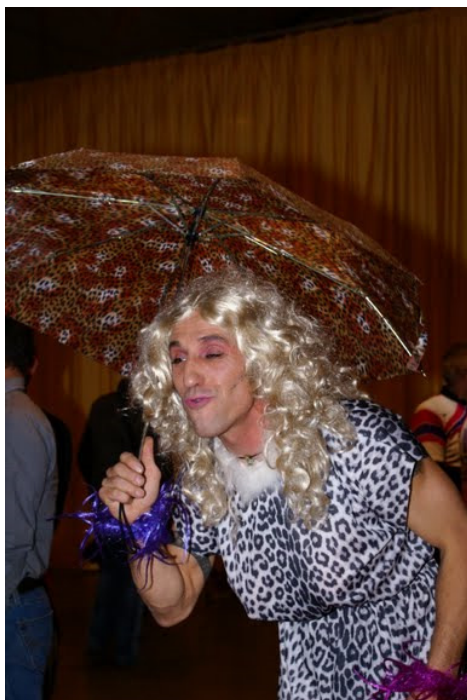
Gros poumons et musclée la fille!