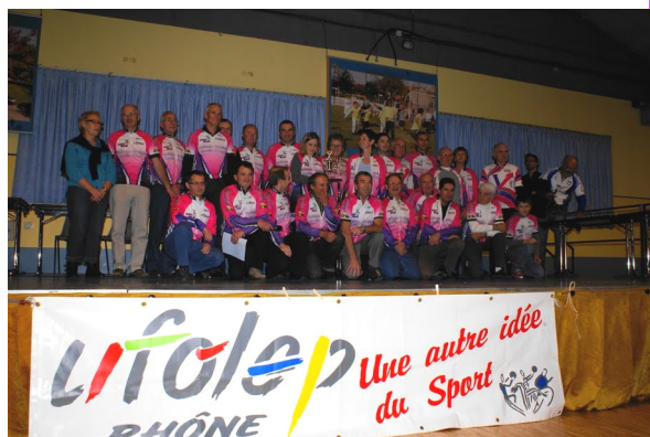
Les Cyclos récompensés!