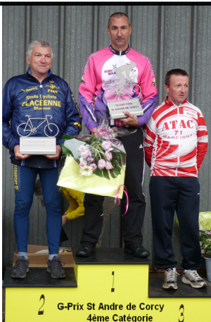
G-Prix St André de Corcy 4ème Catégorie