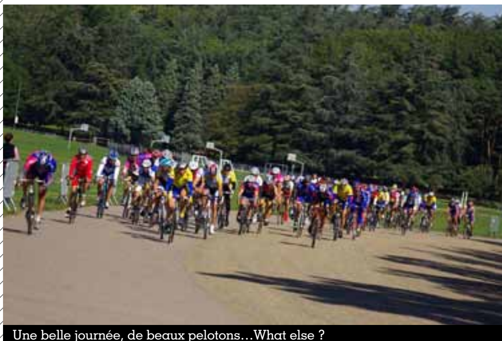
Une belle journée, de beaux pelotons...What else ?