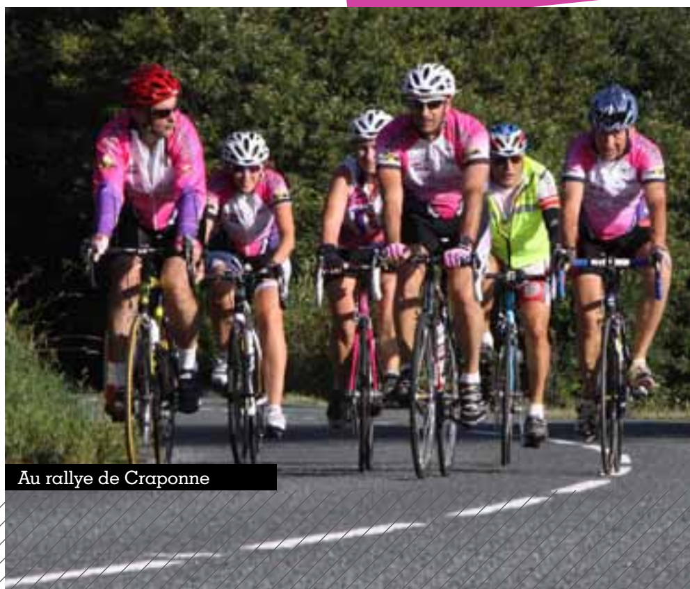
Au rallye de Craponne